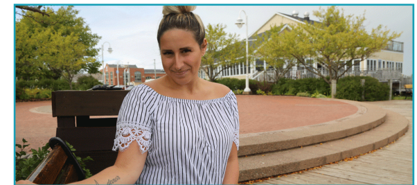
"You're not just saving the life of that one person, but you're changing the life of all the people who love them. It really is the gift of life."

People willing to donate part of their liver will undergo a surgical procedure to have up to one half of their liver removed and transplanted into a recipient in need.